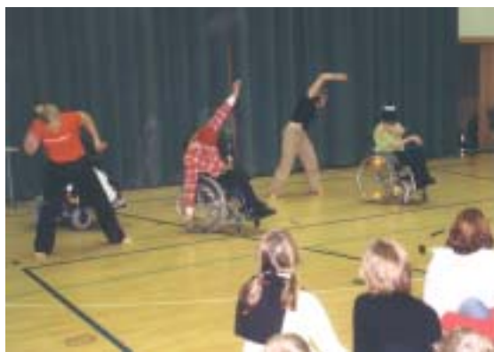
"Gruppo Z" hänför publiken.