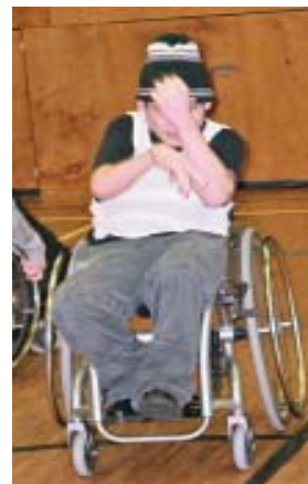
Gruppo Z, otyglad energi

Utgående från sina personliga erfarenheter av en mycket svår allergi i unga år som hotade omintetgöra hans skolgång så drog han parallellt till handikappårets tema. Och sannerligen har skolan förändrats. I den nyrenoverade skolans ADB-klass har nöjligheterna att återge digital information på diskett eller CD-skiva, analog information från t.ex. TV och bildåtergivning med "overhead", kombinerats till en enda apparat som projicerar materialet på en stor tablå på väggen. I matsalen hänger stora TV-